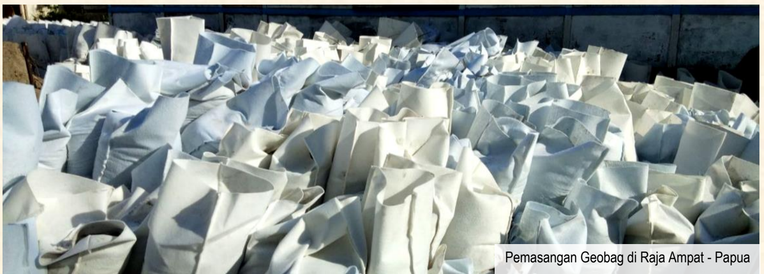
Pemasangan Geobag di Raja Ampat - Papua